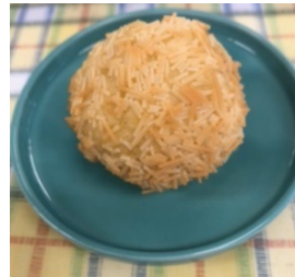
あいあい保育園 のおやつ